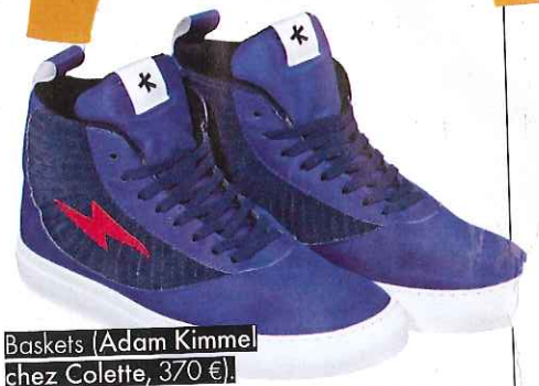
Baskets (Adam Kimmel chez Colette, 370 €).