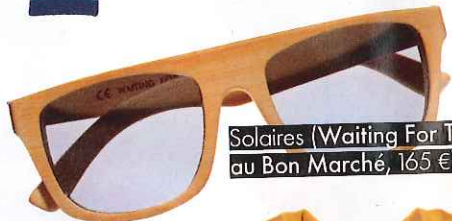
Solaires (Waiting For The Sun au Bon Marché, 165 €).