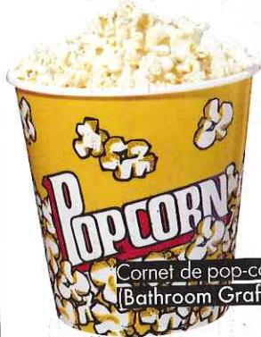
Cornet de pop-corn (Bathroom Graffiti, 3,90 €).