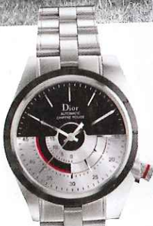
Montre « Chiffre Rouge M01 » (Dior Horlogerie, 6700 €).