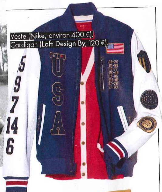
Veste (Nike, environ 400 €). Cardigan (Loft Design By, 120 €).