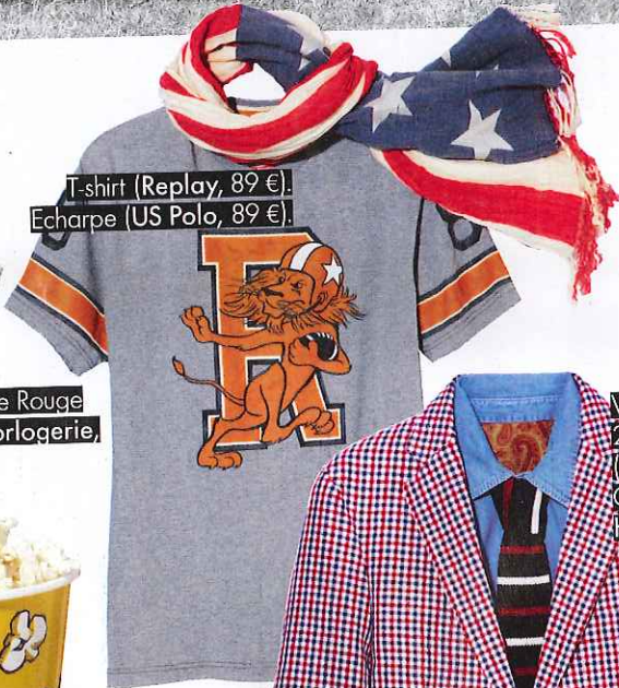
T-shirt (Replay, 89 €). Echarpe (US Polo, 89 €).