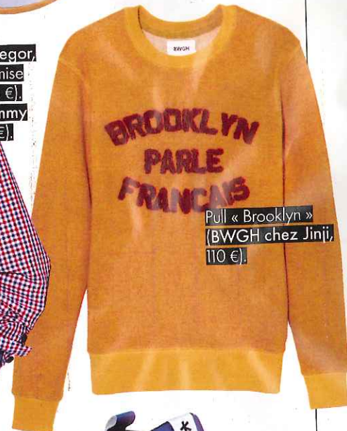
Pull « Brooklyn » (BWGH chez Jini, 110 €).