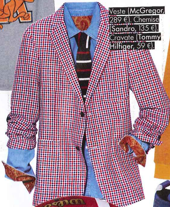
Veste (McGregor, 289 €). Chemise (Sandro, 135 €). Cravate (Tommy Hilfiger, 59 €).