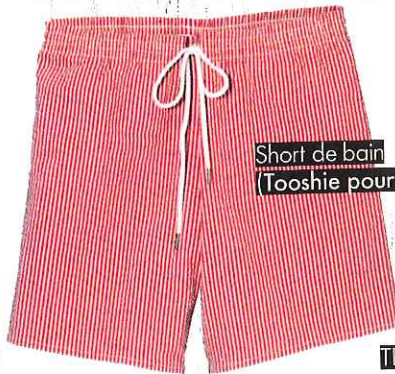
Short de bain (Tooshie pour A.P.C, 140 €).