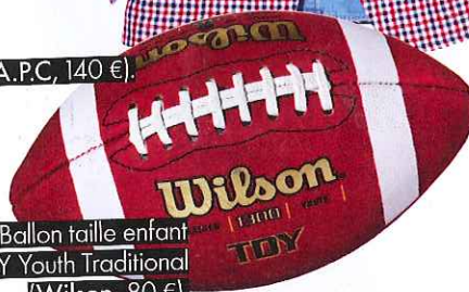
Ballon taille enfant TDY Youth Traditional (Wilson, 80 €).