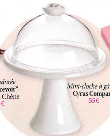
Mini-cloche à gâteau Cyrus Company 55€