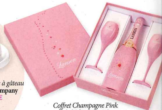
Coffret Champagne Pink Label édition limitée, Lanson, 46€