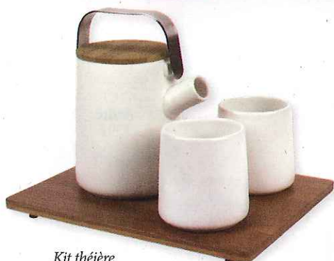
Kit théière « Kookii fot Tea » Lexon, 59€