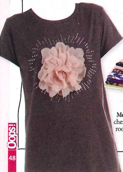
T-shirt Molly Bracken chez MonShow- room.com 39€