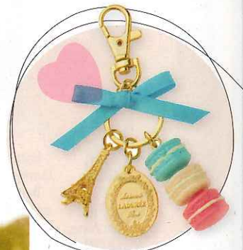
Porte-clefs Ladurée, chez Bathroom Graffiti 29,90€