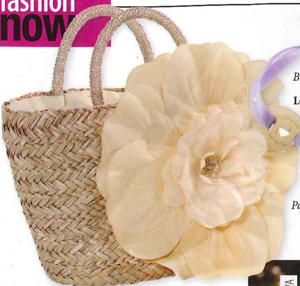
Bracelet « Précieuse Maman » Le Manège à bijoux chez E. Leclerc, 69€