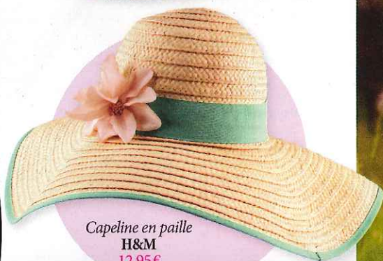
Capeline en paille H&M 12,95€

Parce qu'elles nous supportent depuis qu'elles sont souvent les seules à réussir un peu d'avance pour le 3 juin prochain