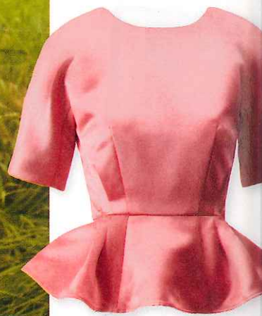
Top à basque, H&M 39,95€