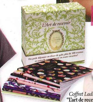
Coffret Ladurée "L'art de recevoir" éditions du Chêne 35,50€