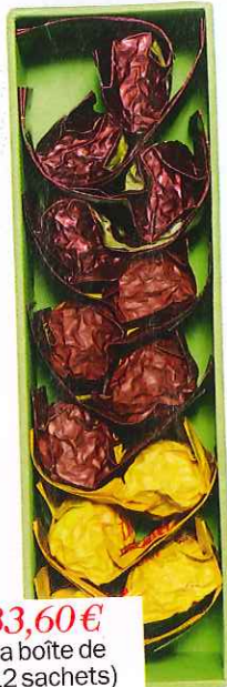
33,60€ (la boîte de 12 sachets) Thé Tie Guan Yin, Fu De Cha.