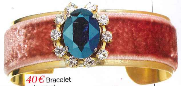
40€ Bracelet velours et strass, Vanina.