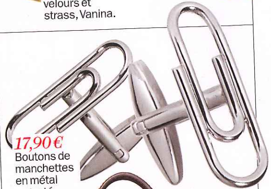
17,90€ Boutons de manchettes en métal argenté, Celio Club.