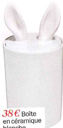
38€ Boîte en céramique blanche, Petite Friture.