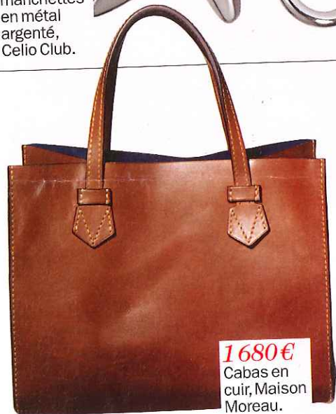
1680€ Cabas en cuir, Maison Moreau.