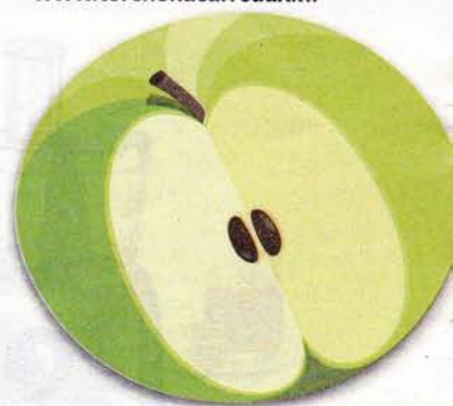
Planche multi-usage pour décorer ou vous aider dans vos préparations. Diam. 30 cm. Torchon à Carreaux, 27,90 €, 01 39 76 83 84 ou www.torchonacarreaux.fr.